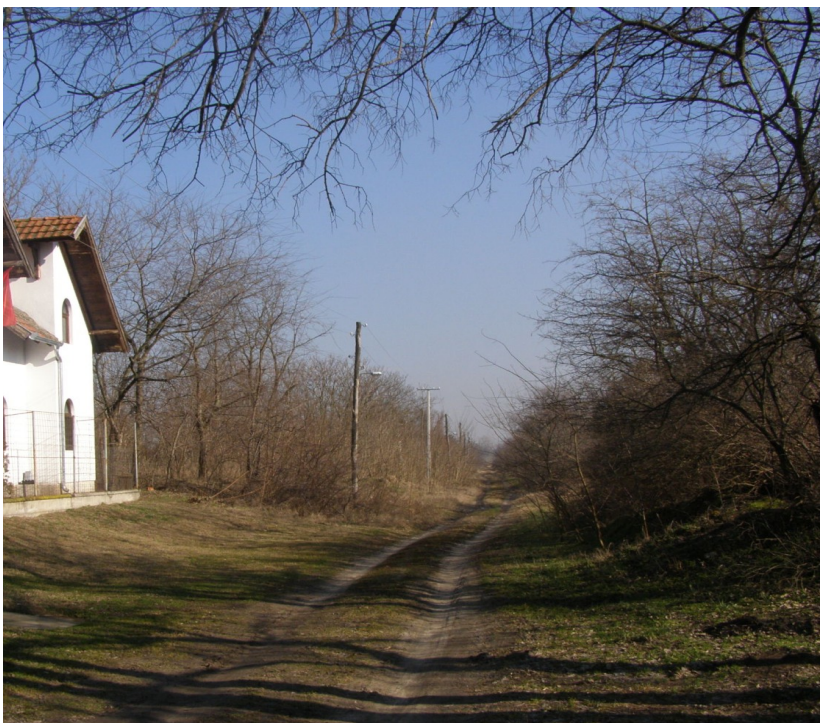
Slika br. 3. - Izgled nadzemne NN mreže

Na prostoru u granicama Plana izgrađena je niskonaponska nadzemna elektroenergetska mreža kao i podzemna telekomunikaciona mreža, dok distributivna gasna mreža (DGM) nije izgrađena. Gasna mreža je izvedena u neposrednoj blizini, tj u ulici Ganjo šor u delu od ulice Erdutska do ulice Proleterskih brigada i sa dovoljnim je kapacitetom prirodnog gasa za snabdevanje svih potencijalnih potrošača prirodnog gasa na predmetnom prostoru.