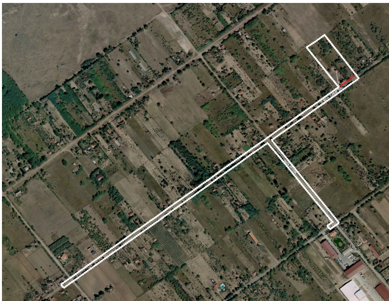
Slika br. 1. – Ortofoto snimak planskog obuhvata