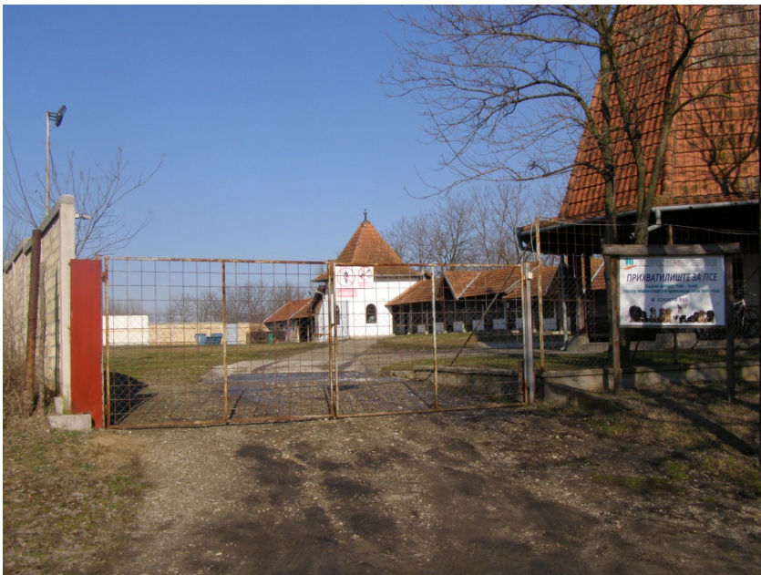
Slika br. 2. – Izgled građevinske izgrađenosti u obuhvatu PDR

Postojeće objekte je potrebno rekonstruisati, kao i dopuniti svim potrebnim prostorima, prostorijama i opremom koje mora da ispunjava prihvatilište za napuštene životinje u skladu sa Pravilnikom o uslovima koje moraju da ispunjavaju prihvatilišta i pansioni za životinje ("Sl. glasnik rs", br. 19/2012) i Zakonom o dobrobiti životinja.